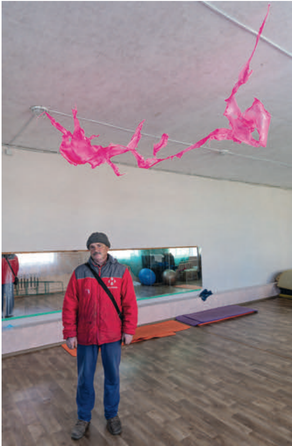
Pantayivka Boarding Lyceum