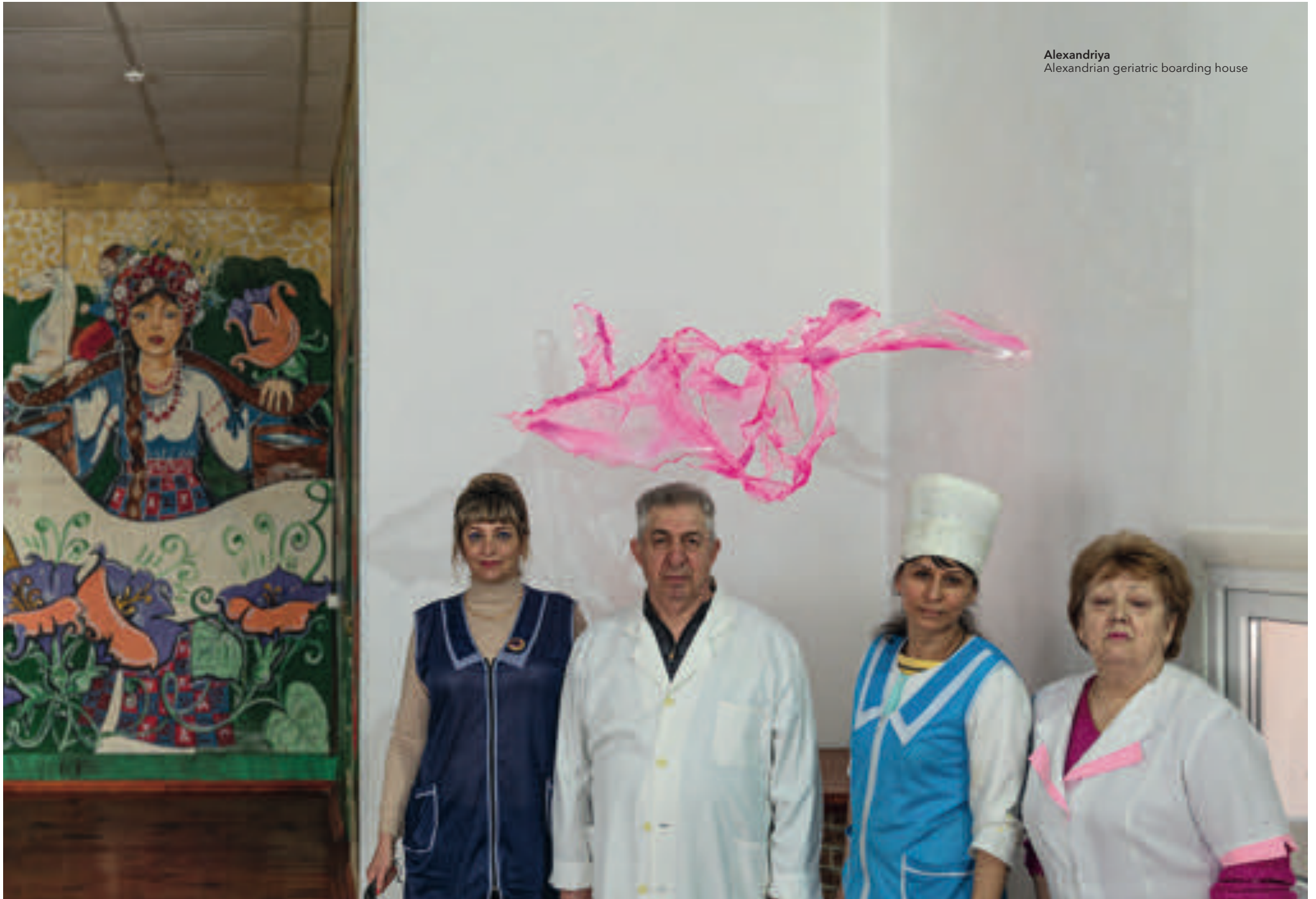
Alexandriya Alexandrian geriatric boarding house