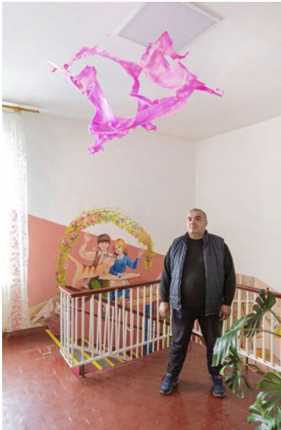
Zolotonosha Zolotonis'ka Spetsial'na Zahal'noosvitnya Shkola-Internat